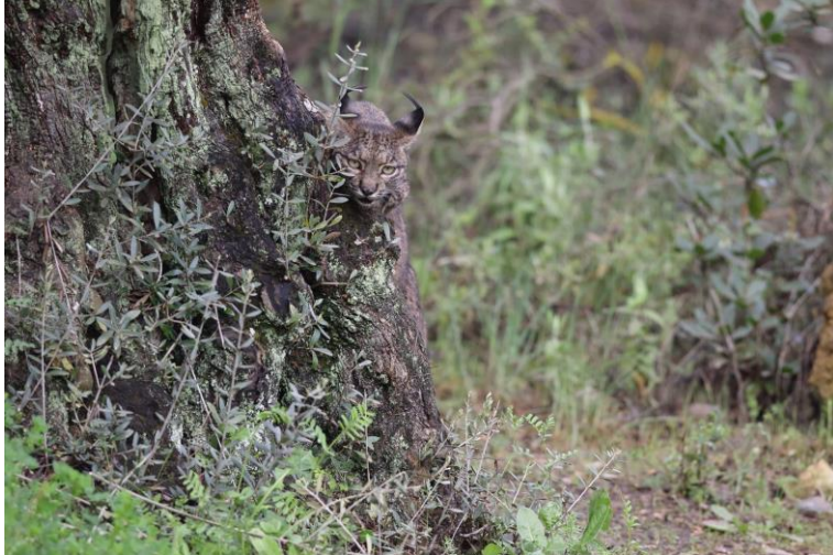
Lince ibérico asomado a un Olivo Centenario

Andalucía es una de las regiones con mayor biodiversidad de Europa: se estima que acoge alrededor del 60 % de las especies terrestres de flora y fauna presentes en España.