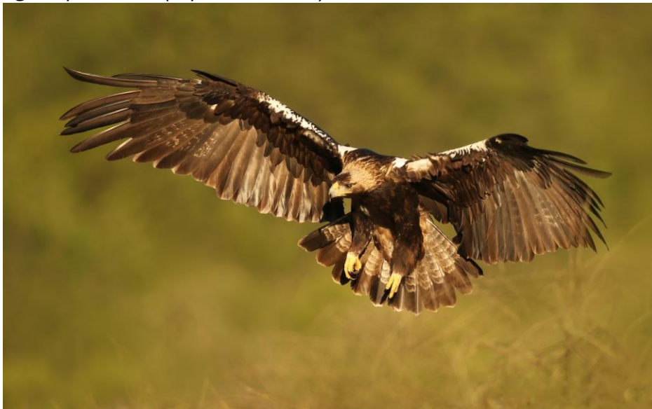
Águila imperial ibérica (Aquila adalberti)