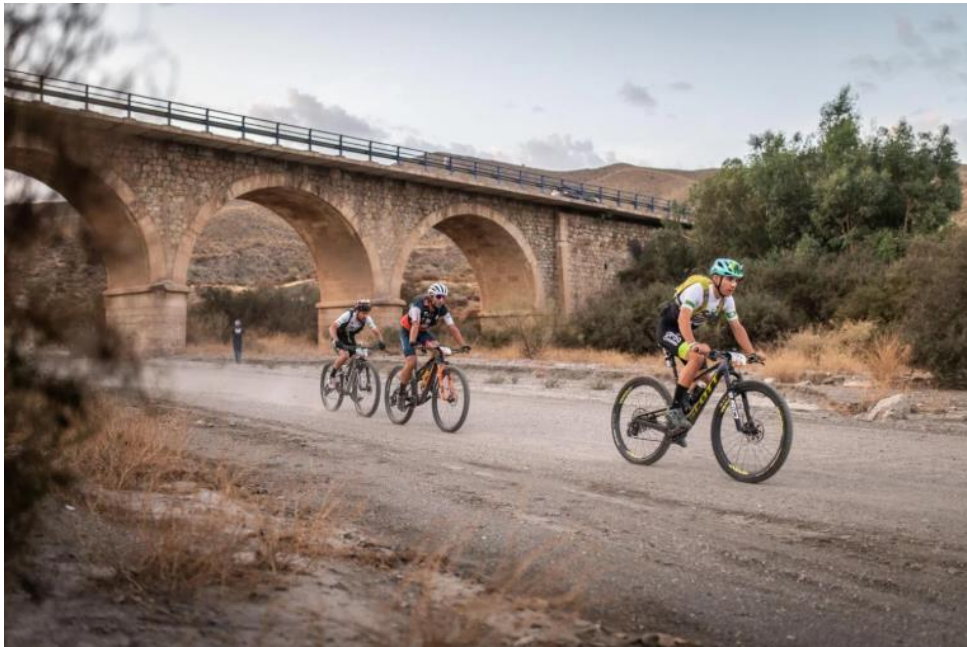
Cicloturistas en el camino Mozárabe de Santiago