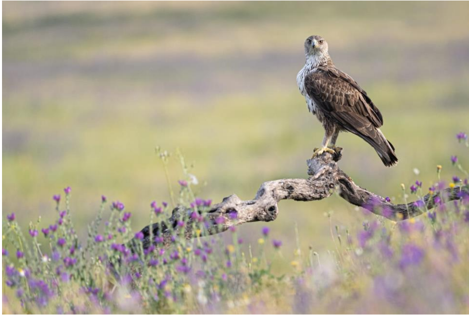
Águila perdicera (Aquila Fasciata)

A lo largo de sus más de 400 kilómetros andaluces, el viajero transita por desiertos, campiñas, sierras y dehesas , encontrando especies emblemáticas como el águila real, la avutarda o el lince ibérico, junto a vestigios romanos, fortalezas árabes y arquitectura popular.