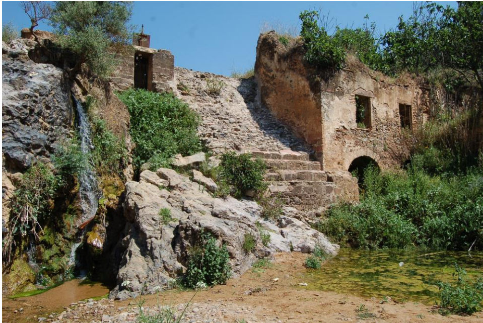
Estado actual molino harinero

Cada tramo del Camino ofrece un mosaico de ecosistemas que constituyen un corredor natural entre los espacios protegidos del sur peninsular: desde el Parque Natural Cabo de Gata-Níjar hasta las Sierras Subbéticas y Sierra Morena , el itinerario conecta hábitats y paisajes, sirviendo de hilo conductor para el turismo activo y el ecoturismo de calidad.