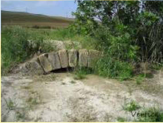
↖ Puente romano Fontalba en 2012