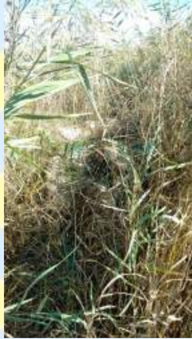
↖ Puente romano Fontalba en 2016